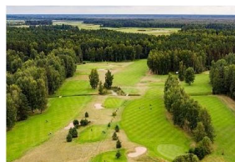
/Golfa klubs Viesturi/