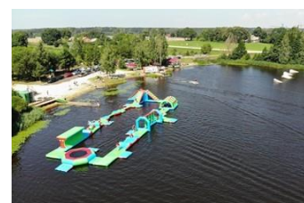
/Mārupes veikparks, pludmale/