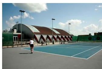
/Tenisa klubs ACB/